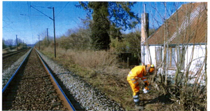
Illustration d'une intervention de maîtrise de la végétation, dans les Hauts-de-France, 2022.

Conscient de la gêne occasionnée, SNCF Réseau vous remercie de votre compréhension en cette période de travaux.